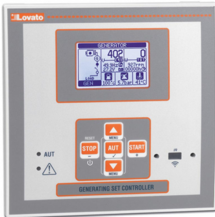
Lovato RGK600 - итальянский контроллер для управления дизельной электростанций, с широким функционалом и русскоязычным интерфейсом. Позволяет контролировать множество параметров работы установки во всех штатных режимах. Разработка итальянской компании Lovato Electric.