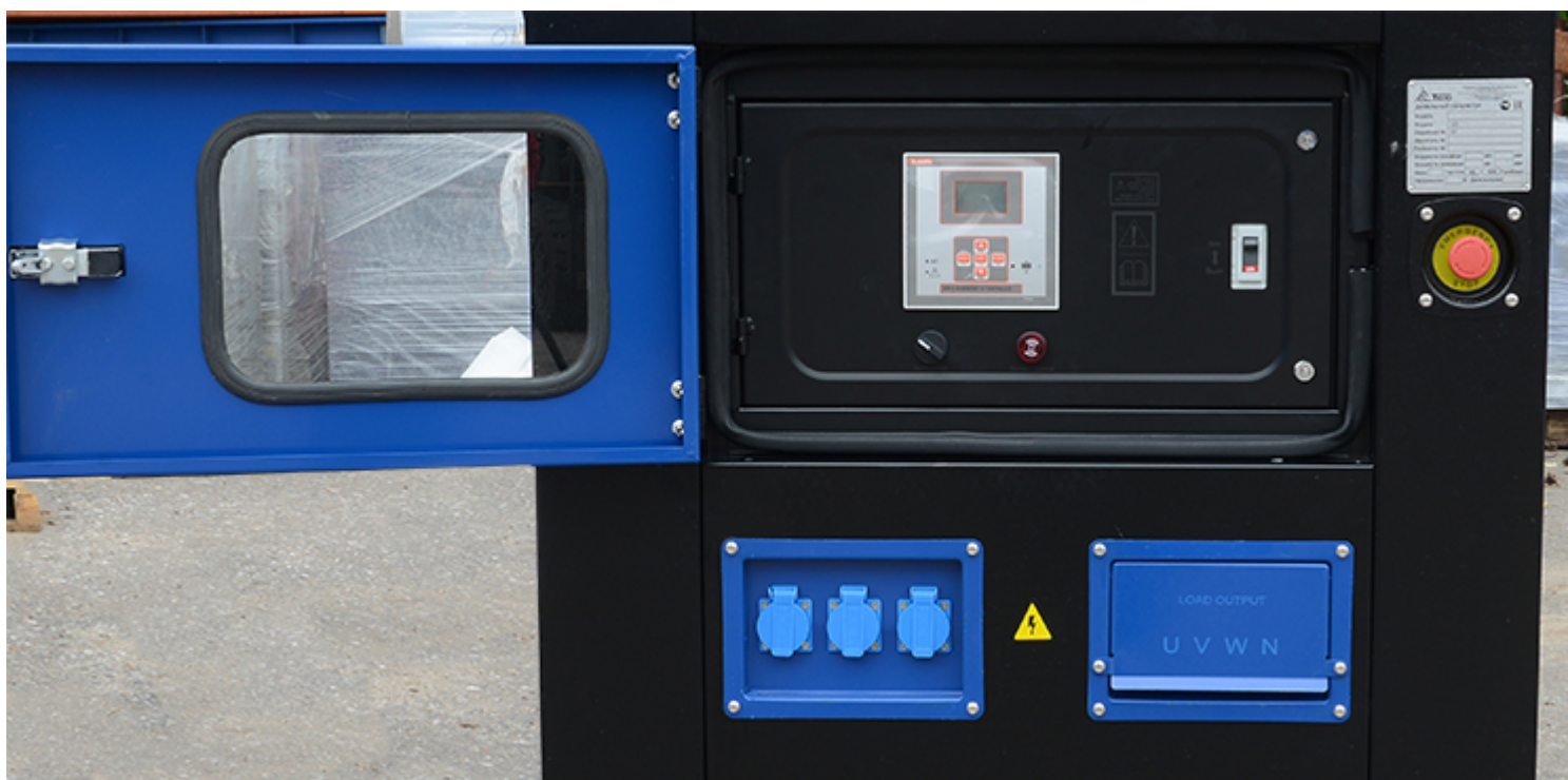
Окошко для визуального контроля за работой и кнопка остановки дизель генератора находятся непосредственно на корпусе кожуха