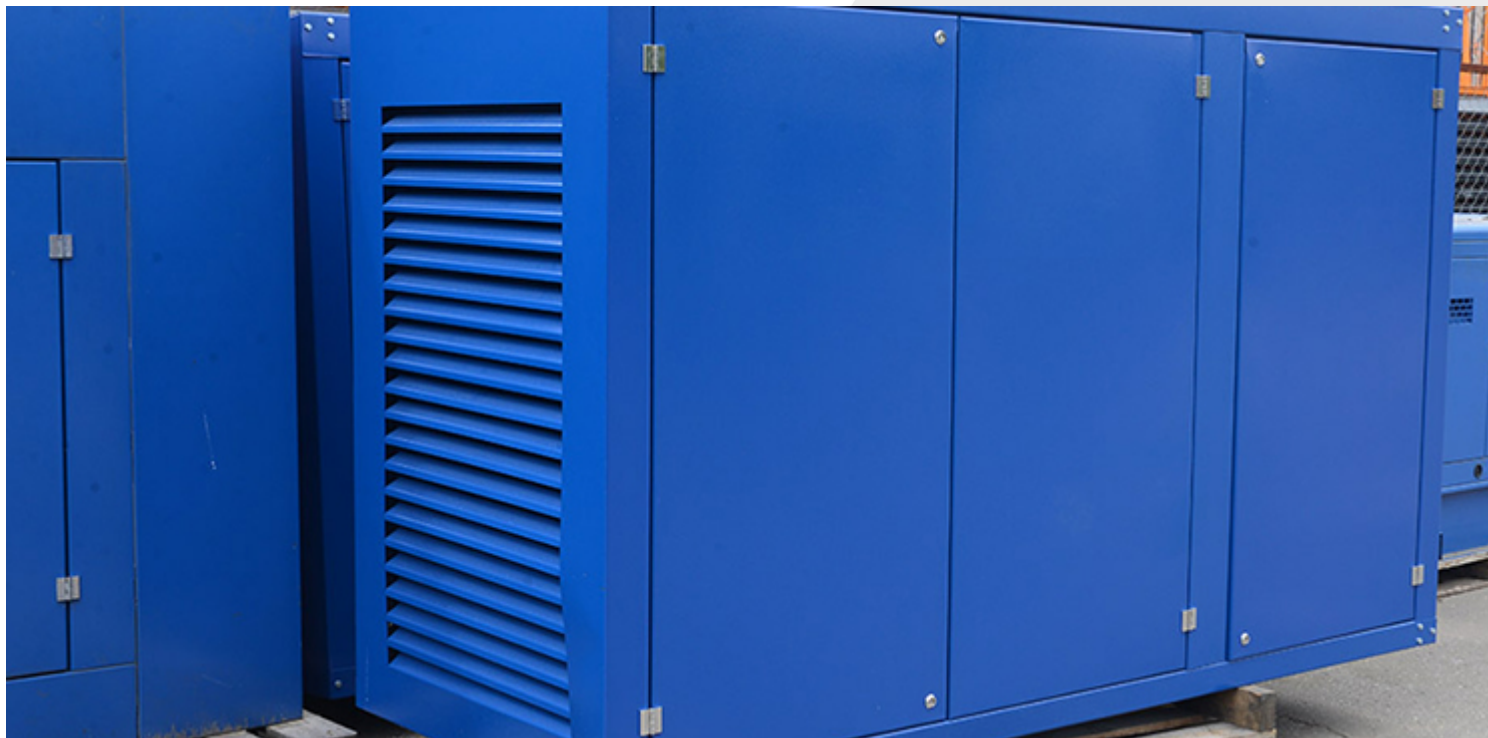
Кожух изготавливается из листовой стали толщиной не менее 1,5 мм, имеет проемы приточной и вытяжной вентиляции, защищенные стальными жалюзийными решетками